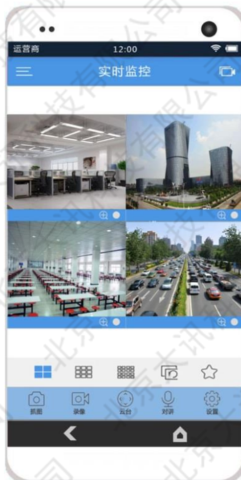
图 1-3 手机 APP 播放界面