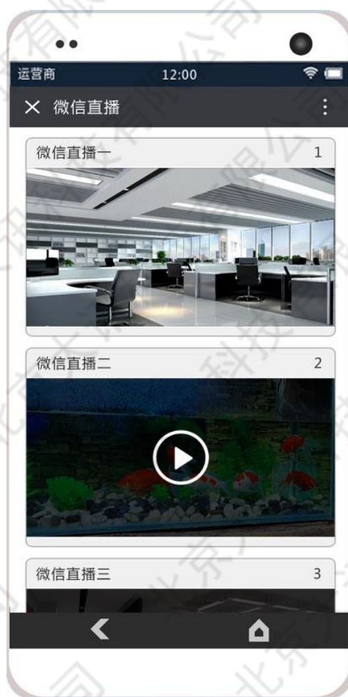
图 1-4 微信公众号播放界面