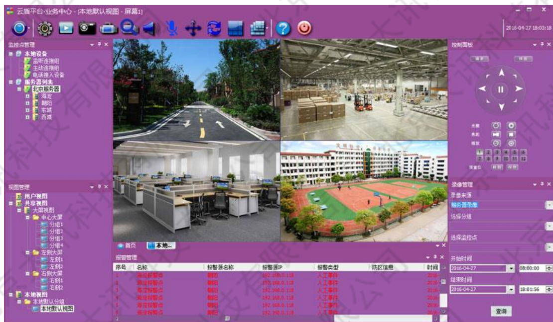
图 1-2 PC 客户端界面