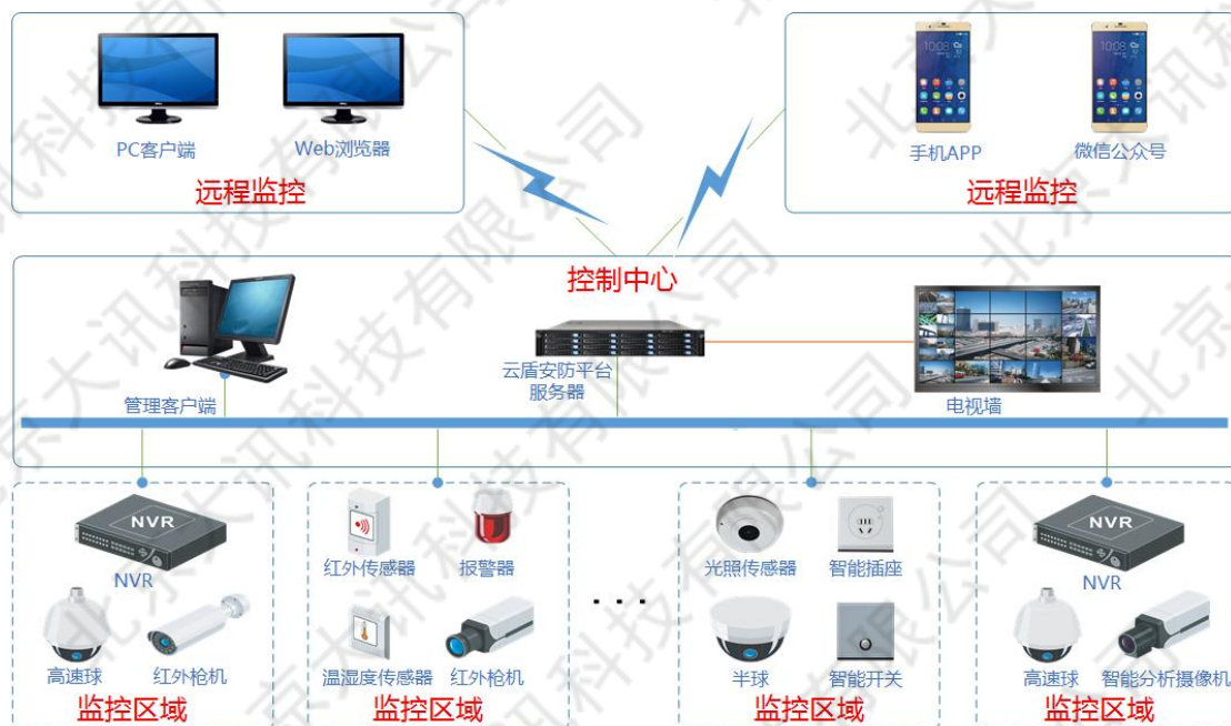
图 2-1 云盾安防平台客户端典型应用