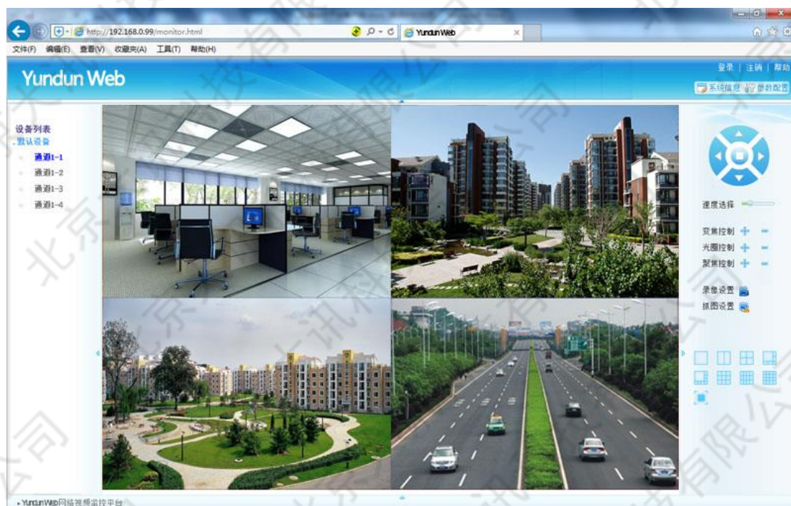
图 1-5 Web 浏览器界面